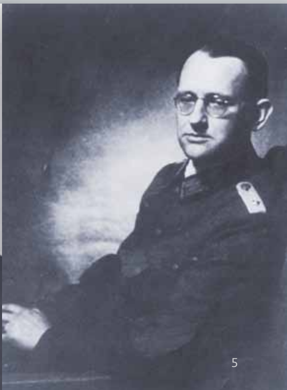
Fabian von Schlabrendorff

Auch die Mehrheit der deutschen Bevölkerung stand Mitte 1944 trotz der Invasion der Westalliierten in der Normandie sowie der