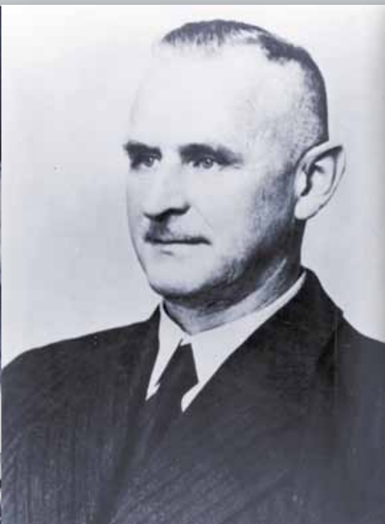
Dr. Carl Friedrich Goerdeler Gedenkstätte Deutscher Widerstand