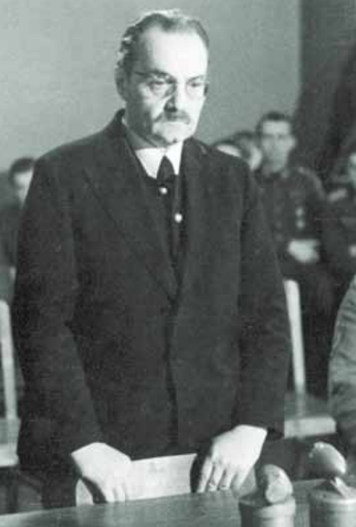
Hermann Kaiser, einer der wichtigsten Organisatoren des „20. Juli“, wurde am 17. Januar 1945 zum Tode verurteilt. Das Urteil wurde sechs Tage darauf in der Strafanstalt Berlin-Plötzensee vollstreckt.