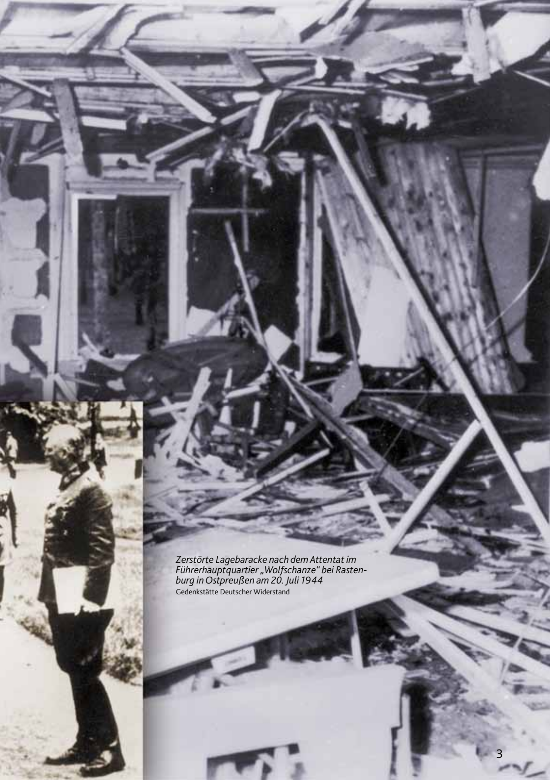
Zerstörte Lagebaracke nach dem Attentat im Führerhauptquartier „Wolfschanze“ bei Rasten- burg in Ostpreußen am 20. Juli 1944