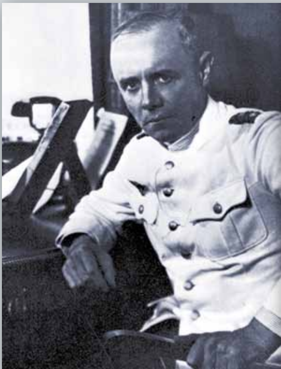
Generaloberst a. D. Ludwig Beck

Nur in Prag, Paris und Wien waren die Alarmierung und sogar die Verhaftungen regimetreuer Kräfte angelaufen bzw. zum Teil bereits durchgeführt worden. In Paris hatten immerhin 1.200 Mann SS, SD und Polizei fest-