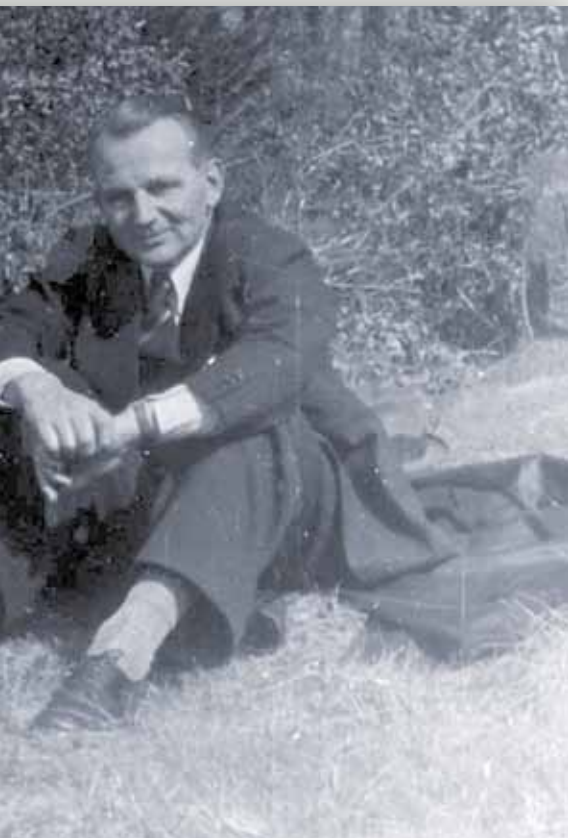
Carlo Mierendorff (rechts) und Emil Henk

Die damals nicht enttarnten Widerständler, aber auch jene, die gefasst worden waren und trotzdem mit dem Leben davongekommen sind, haben sich bald darauf nahezu ausnahmslos ins Zeug gelegt für den durch die militärische Niederringung des NS-Regimes und das nachfolgende diesbezügliche Entge-